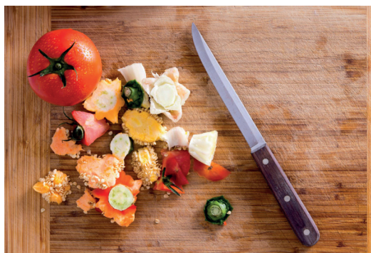
Třídění bioodpadu začíná v kuchyni

K třídění organických zbytků v kuchyni nepotřebujete nic speciálního. Zbytky můžete odkládat do jakékoliv omyvatelné nádoby (může to být dóza, miska nebo malý kbelík). Musí splňovat jen dva přísné parametry: musí se vám líbit a je vhodné ji mít po ruce. Na sběr bioodpadu lze používat také papírové pytlíky. Když je pak obsah nádoby nebo sáčku naplněn, stačí je odnést na místo, kde budou organické zbytky zkompostovány. Možností je několik: zahradní kompostér, domácí vermikompostér a v případě možnosti komunitní kompostér nebo svoz.