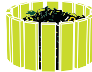
Kompost v komunitní zahradě