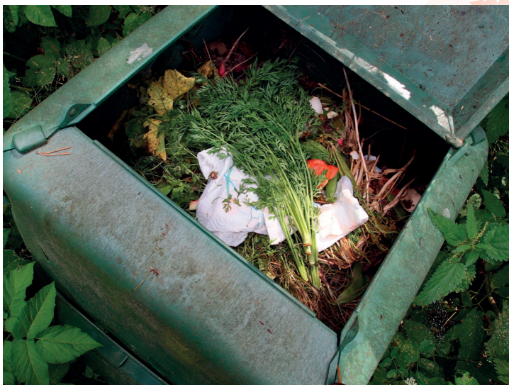
Organické zbytky rostlinného původu patří na kompost

Bioodpad, tedy organické zbytky rostlinného původu, tvoří 40 až 60 % obsahu běžných popelnic na směsný odpad. Organickým zbytkům jsme se naučili říkat bioodpad. Není to však úplně šťastné pojmenování. Ze slova bioodpad máme pocit, že když se nám opravdu ocitne v rukách, je to něco co je třeba vyhodit a už se o to nestarat. Ale je to přesně naopak. Bioodpad není odpad! Je to cenná surovina, kterou můžeme dále využívat a kterou bychom s ohledem na životní prostředí využívat měli.